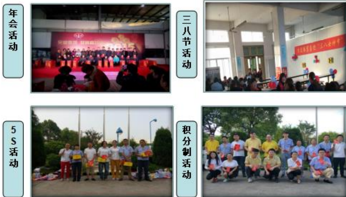
丰富多彩的文体活动

公司除了生产上的安全关注，公司也十分重视员工的文化建设和健康。这主要体现在我们努力为员工创造舒适的工作环境和生活环境，如办公室和车间、食堂和宿舍、运动和休闲、阅读及娱乐等等。除了硬件保障之外，我们还通过诸如劳动技能竞赛、员工聚餐和文娱活动等员工活动来调动员工的工作激情，丰富员工的业余生活，获得了员工的广泛好评。如下图：